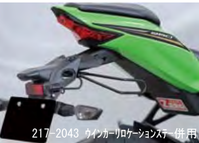
217-2043 ウインカーリロケーションステー併用

●スタイリッシュなテールカウルですが、ツーリング用の振り分けバッグを取り付けると、その形状が逆にバッグの固定を難しくさせます。その不安を取り除くバッグサポートが登場。